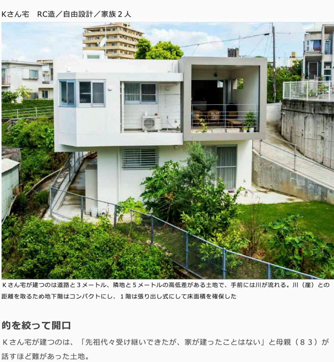
Kさん宅が建つのは道路と3メートル、隣地と5メートルの高低差がある土地で、手前には川が流れる。川（崖）との距離を取るため地下階はコンパクトにし、1階は張り出し式にして床面積を確保した