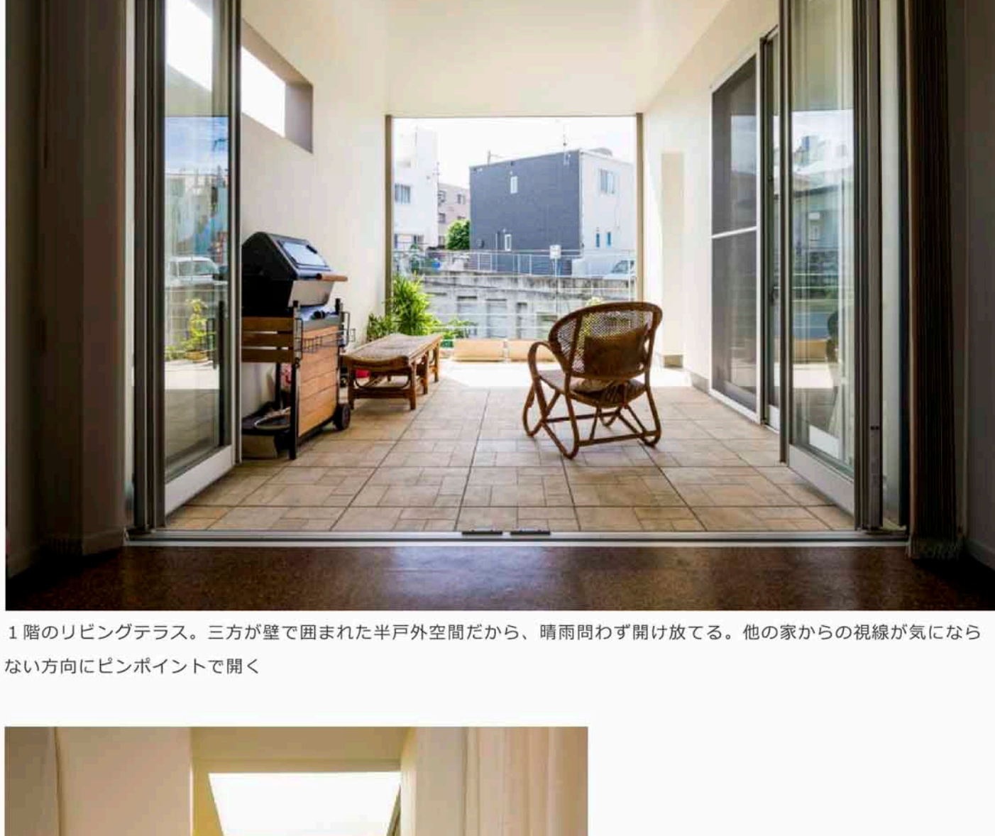
1階のリビングテラス。三方が壁で囲まれた半戸外空間だから、晴雨問わず開け放てる。他の家からの視線が気にならない方向にピンポイントで開く