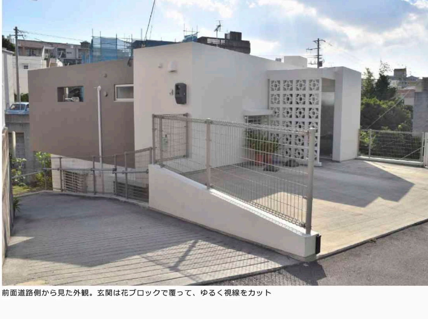
前面道路側から見た外観。玄関は花ブロックで覆って、ゆるく視線をカット